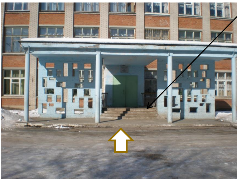
МУ СОШ № 7, пр-т Строителей, д. 10-а

При наличии лестницы на входе в здание для инвалидов-колясочников нужен пандус.