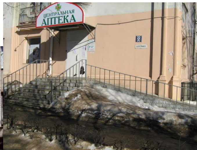
Аптека ул. Горького