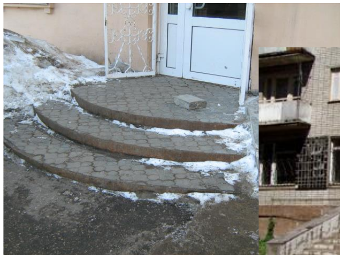
Магазин Продукты ул. Горького