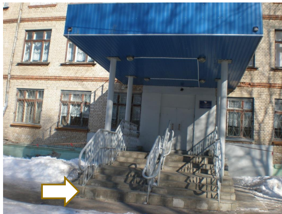
МУ СОШ № 15, г.Владимир, ул. Чернышевского, д. 76

Отсутствие поручней у лестниц делает ее недоступной для инвалидов-опорников. Поручни должны быть вдоль обеих сторон лестниц на высоте 0,9 м. Диаметр поручня 3-4,5 см.